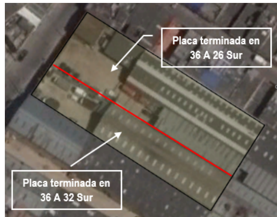
Imagen 2. División del Predios 1 (ver imagen 1) donde operaba MONTERO JIMENEZ Y CIA LTDA