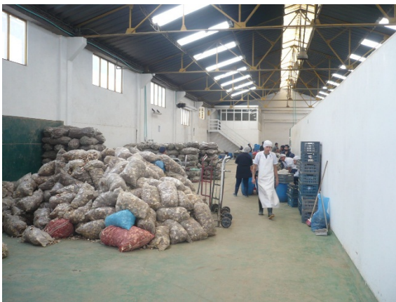
Fotografía 7. Zona interior del actual predio Cr 68 D 36 A 32 Sur, donde opera AGROLLANOS AGRICOLA DEL LLANO.