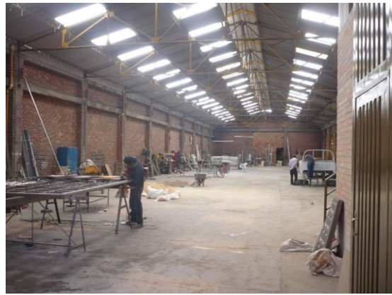
Fotografía 3. Zona exterior del actual predio Cr 68 D 36 A 26 Sur