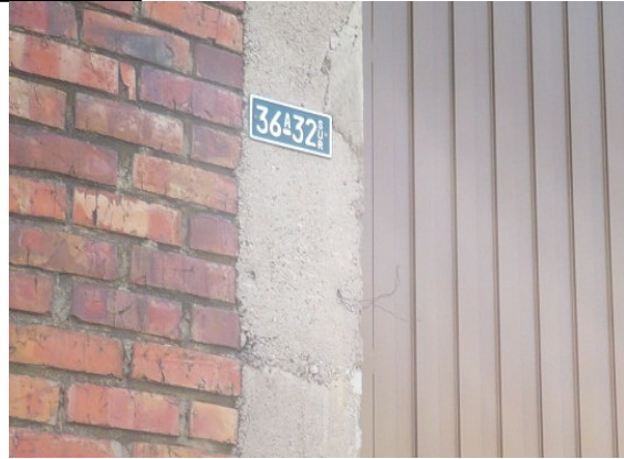
Fotografía 5 y 6. Fachada del predio con placa Cr 68 D 36 A 32 Sur (Donde operaba MONTERO JIMENEZ Y CIA LTDA)