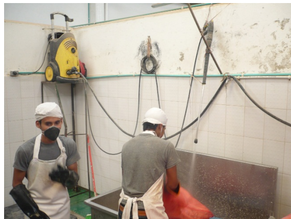
Fotografía 8. Actividad de lavado del producto.

Dado lo encontrado, se le recomendó a personal de AGROLLANOS AGRICOLA DEL LLANO LTDA, para que realizaran el trámite de registro de vertimientos, situación que fue acogida por el usuario y realizó dicha solicitud ante la Secretaría mediante el proceso Forest 3047968.