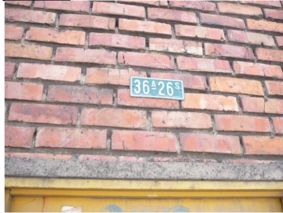
Fotografía 1 y 2. Fachada del predio con placa Cr 68 D 36 A 26 Sur